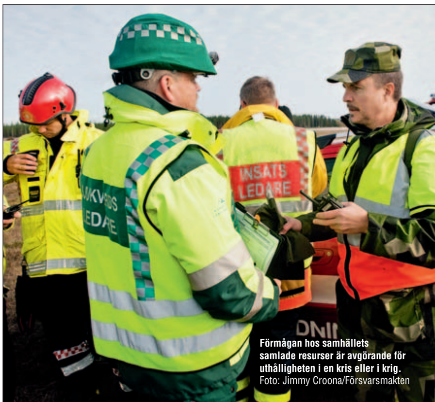
Förmågan hos samhällets samlade resurser är avgörande för uthålligheten i en kris eller i krig.

Här någonstans blir samhällets uteblivna beredskap ett hinder för min möjlighet att ställa upp. Jag bedömer att jag – trots en stark vilja att vilja ställa