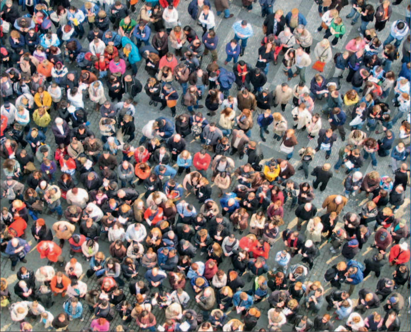
Satsningarna på större seminarier som Pax Baltica syftar till att nå de människor som behöver mera kunskap om säkerhets- och försvarfrågorna.

många studenter också från andra sidan Östersjön.