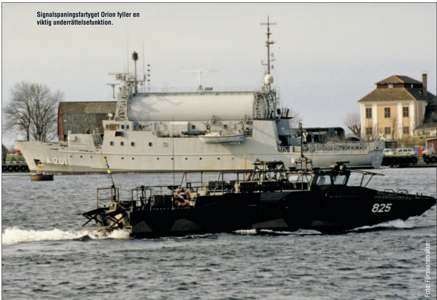
Signalspaningsfartyget Orion fyller en viktig underrättelsefunktion.

rets Radioanstalt (FRA) samt Säkerhetspolisen (SÄPO). Försvarets Materielverk (FMV) samt Totalförsvarets Forskningsinstitut (FOI) som också bidrar i underrättelsearbetet. Resurserna är begränsade och vi har inte lika många och stora organisationer som några andra aktörer, men det är inte enbart en nackdel. Vi har t ex bra förutsättningar för att skapa ett nära och förtroendefullt samarbete. Chefer träffas ofta och personal som arbetar med en viss fråga vid en myndighet känner kollegorna vid de andra