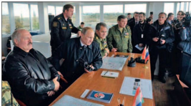
Övningsledare och Rysslands president Vladimir Putin.

Den vitryska/ryska övningen Zapad har inte gått obemärkt förbi i norra Europa. Nyhetsbevakningen kopplad till den ryska övningsverksamheten har varit påfallande. Både försvarspolitiker i Polen och Baltikum har uttryckt oro över Rysslands