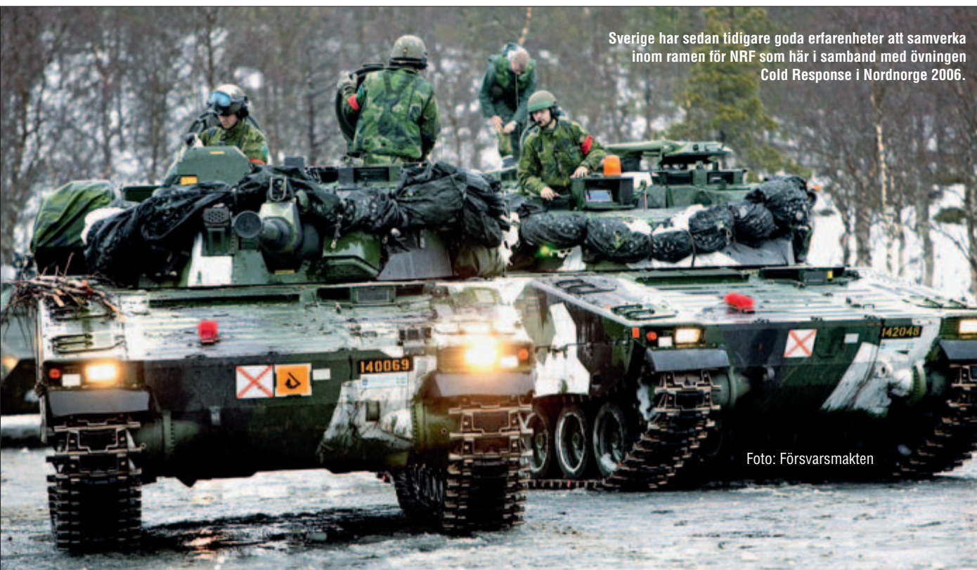
Sverige har sedan tidigare goda erfarenheter att samverka inom ramen för NRF som här i samband med övningen Cold Response i Nordnorge 2006.