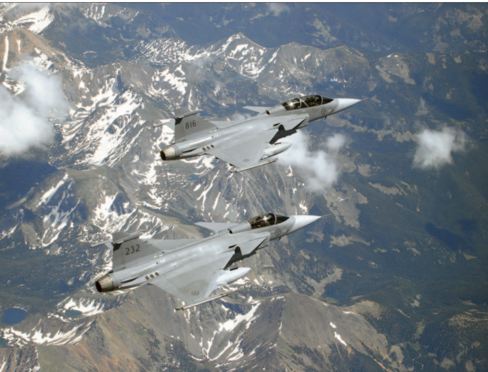
Den försämrade ekonomin riskerar att påverka incidentberedskapen.