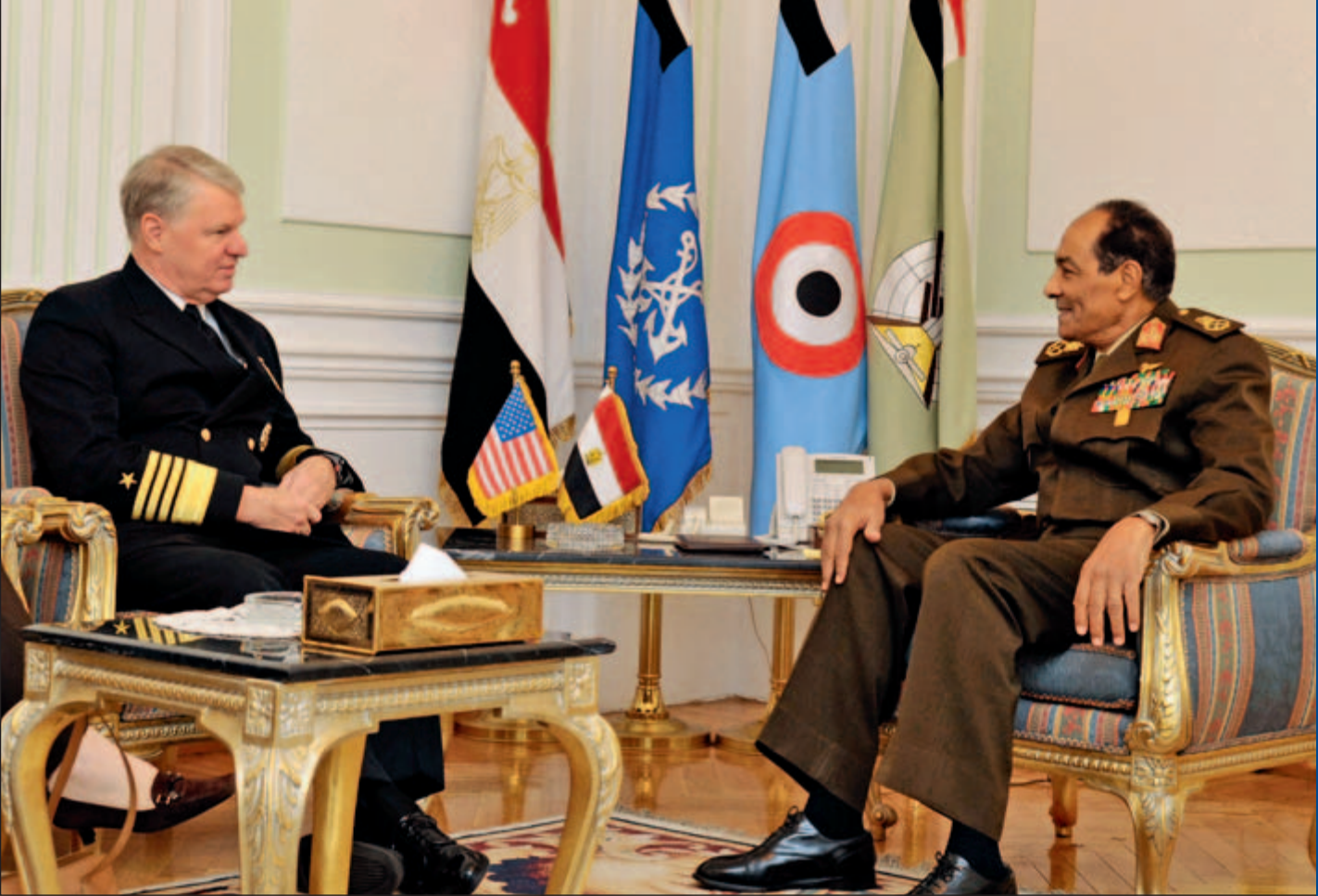
USAs säkerhetsintressen i regionen är omfattande där konsultationerna på högsta exekutiva nivå är frekvent återkommande. Bilden visar den tidigare amerikanske marinchefen Amiral Gary Roughead och den egyptiske försvarsministern, Fältmarskalk Tantawi.

mitetsfrågan ställs på sin spets och blir tydlig som den mest basala frågeställningen.