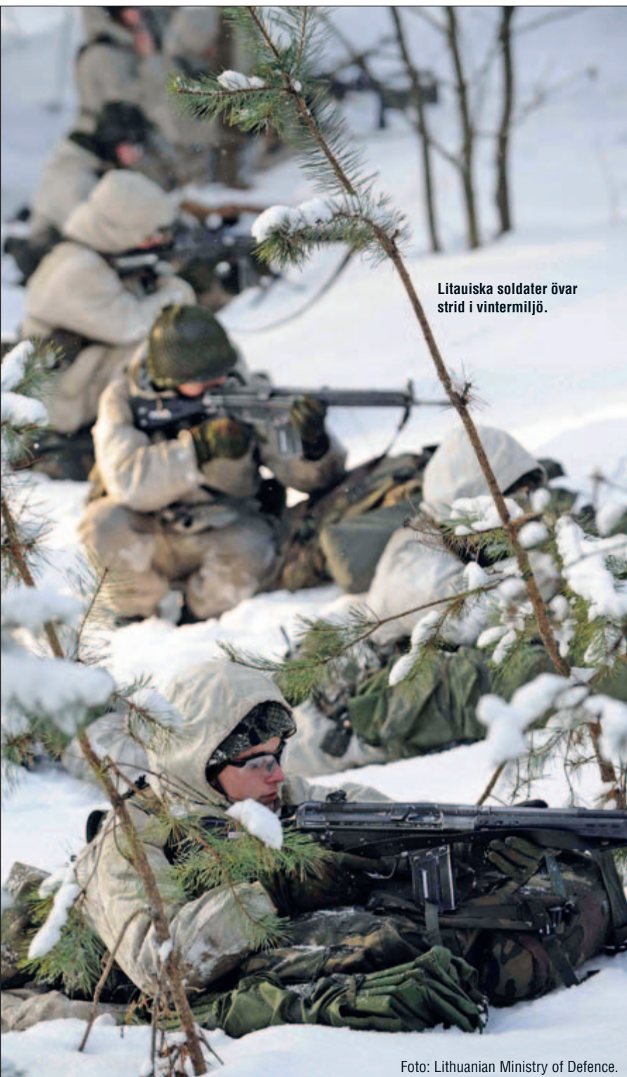
Litauiska soldater övar strid i vintermiljö.