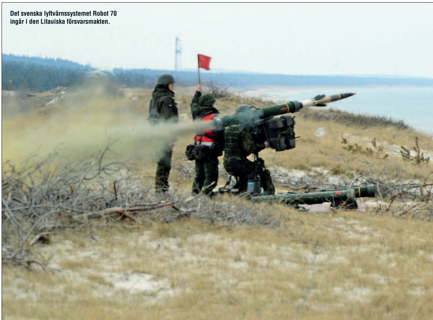
Det svenska lyftvärnssystemet Robot 70 ingår i den Litauiska försvarsmakten.

Urbelis betonar att den enskilt viktigaste faktorn för ett fungerande försvar, inte minst i Baltikum, är den mentala viljan hos dess invånare till att göra motstånd och han viktligger