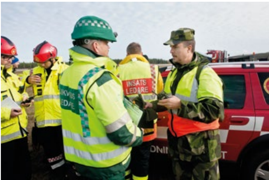
Totalförsvaret ska kunna verka såväl i fred som i kris och krig.

Det krävs att regeringen inrättar en funktion som tar ett helhetsgrepp om totalförsvaret, främst om ledningsfrågan. Ansvar bör ligga på Försvarsdepartementet, eftersom underrättelseunderlaget finns där. Det innebär inte alls att man lämnar ifrån sig beslutsmandat: besluten ska tas av regeringen och av myndigheter i enlighet med mandat beskrivna i instruktioner och regeringsuppdrag. Men det krävs en beredningsförmåga som idag inte finns i Regeringskansliet. Det är möjligt att kapaciteten finns, men organisatoriskt och uppgiftsmässigt ägnar man sig inte åt en beslutsberedning som leder till försvareffekter, särskilt inte om tidsbrist föreligger.