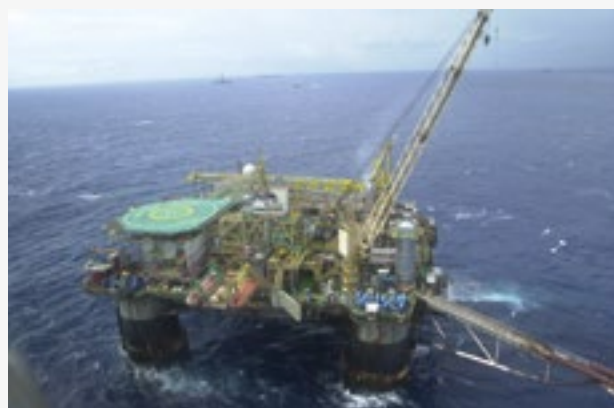
Oljeplattform i Brasilien.

de oljebolag med de högsta kostnaderna, t ex skifferoljebolag i USA, som kommer att drabbas, utan snarare de som har minst lagerkapacitet.