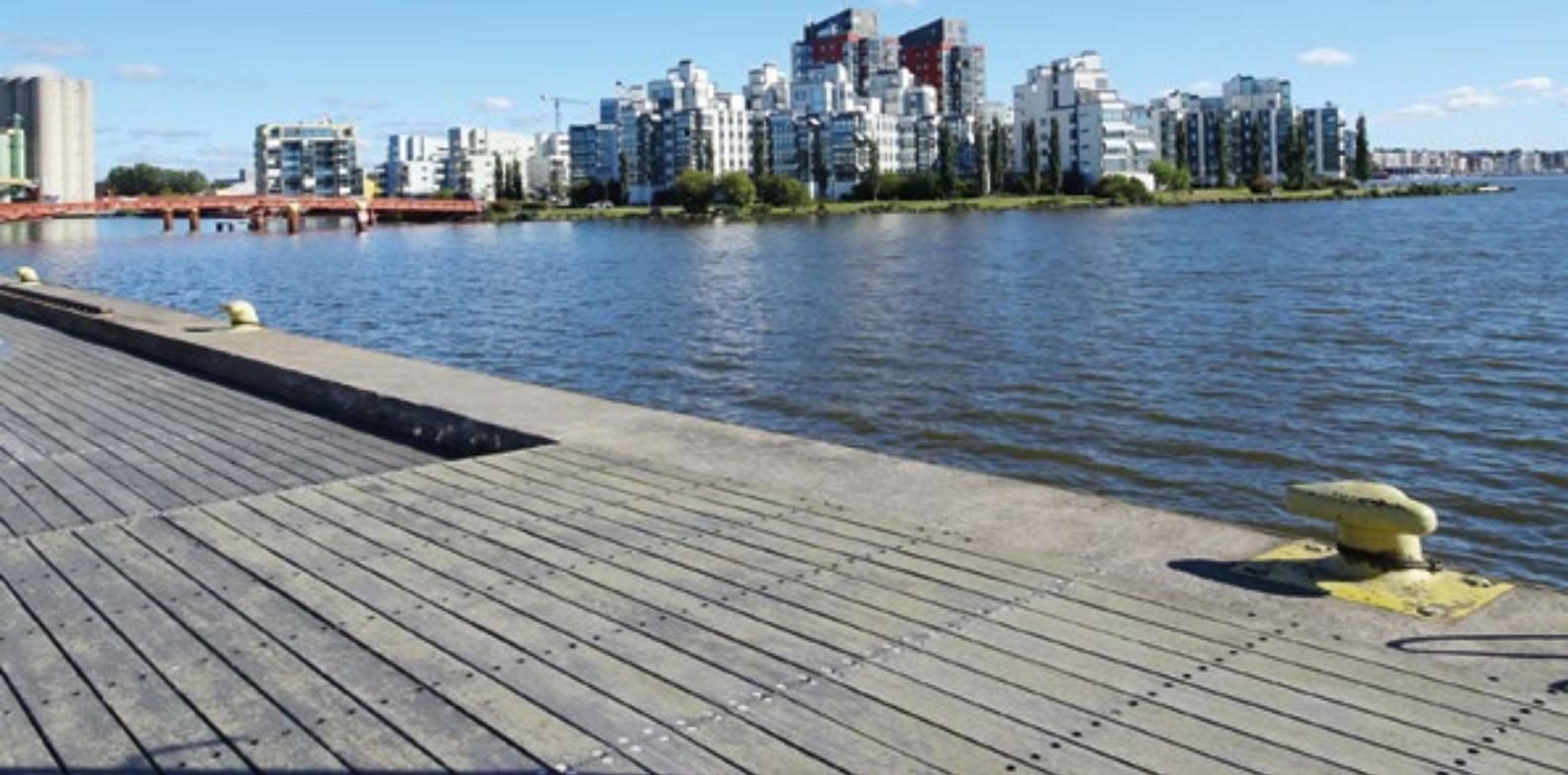
Länsstyrelserna arbetar för att klara höjd beredskap i vårt svenska samhälle.

Är Sverige i krig får länsstyrelserna rollen som högsta civila totalförsvarsmyndighet inom länet och ska då verka för att största möjliga försvarseffekt uppnås. Länsstyrelsen ska samordna de civila försvarsåtgärderna och verka för att civil verksamhet som har betydelse för försvarsansträngningarna bedrivs med en enhetlig inriktning. Länsstyrelserna ska också i samråd med Försvarmakten verka för att det civila och det militära försvaret samordnas och för att länets tillgångar fördelas och utnyttjas så att försvarsansträngningarna främjas. Av vikt är att upprätthålla förbindelsen med Regeringen och centrala myndigheter, men bryts förbindelsen ska länsstyrelsen självständigt genomföra de åtgärder som behövs för den civila försvarsverksamheten och till stöd för det militära försvaret.