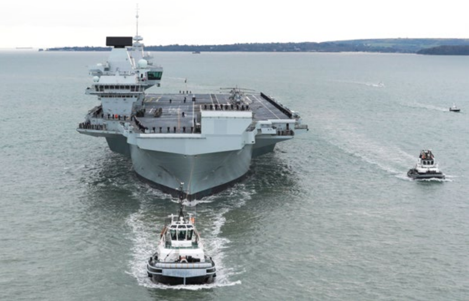
Med europeiska mått mätt är Storbritannien alltså en betydande militärmakt. Bilden visar det brittiska hangarfartyget Prince of Wales (RO9) av Queen Elizabeth-klass.

som 1956 efter den misslyckade Suezoperationen. Då gällde det endera rollen som en junior partner till USA eller en senior partner i försöken att skapa en europeisk maktbas som inte skulle behöva hamna i korselden mellan USA, Kina och Ryssland. Den konservativa regeringen i London skulle dock knappast se på världen med samma glasögon. Det finns de som gärna skulle vilja se sitt land som ett stort europeiskt Singapore, en handels- och finansstat med goda relationer i alla väderstreck, men med egna globala nätverk, och regelverk med ty åtföljande konkurrensfördelar.