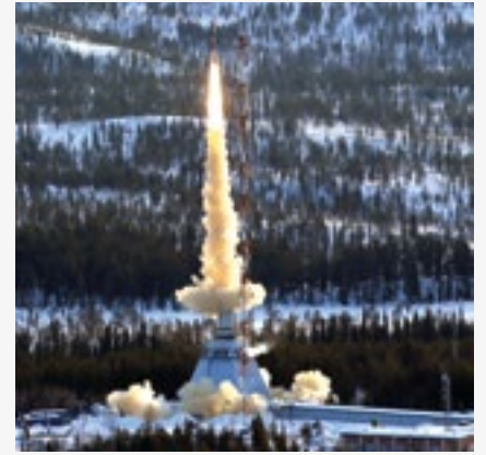
Uppskjutning av TEXUS 50 med VSB-30 raket på Esrange, Kiruna.

aspekterna avseende förmågan att kunna sända upp små satelliter.