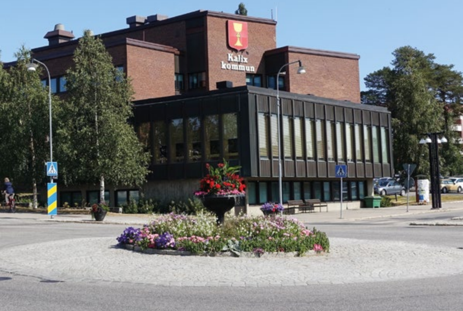
Kommunerna behöver en genomtänkt organisation för höjd beredskap och krig där lagstöd för detta är av stor betydelse.

Att orden kris och krig är svåra att hålla isär för kommunala (och andra!) beredskapsplanerare beror också på att flera författningar, olyckligtvis, har regler för kris och extraordinära händelser i fredstid och regler för höjd beredskap vid krigsfara och krig i samma författning, men under olika rubriker. Detta gäller flera viktiga författningar som rör den kommunala verksamheten.