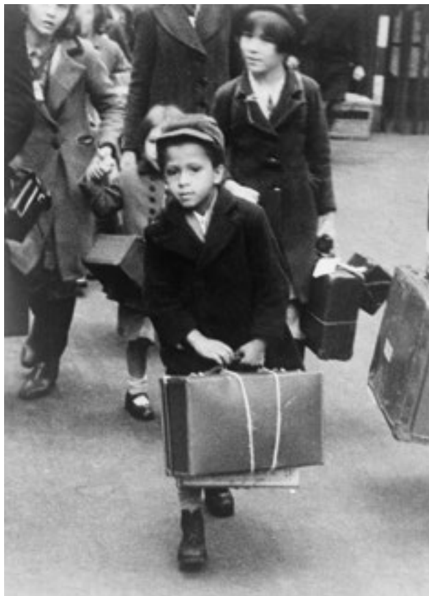
Ensamma barn mot en osäker framtid.