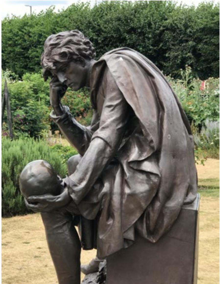
Eftertankens kränka blekhet? Hamlet grubblar i coronans ljus.

Risken för krig måste hela tiden diskuteras inom ramen för en analys av Sveriges och svenskarnas bero-