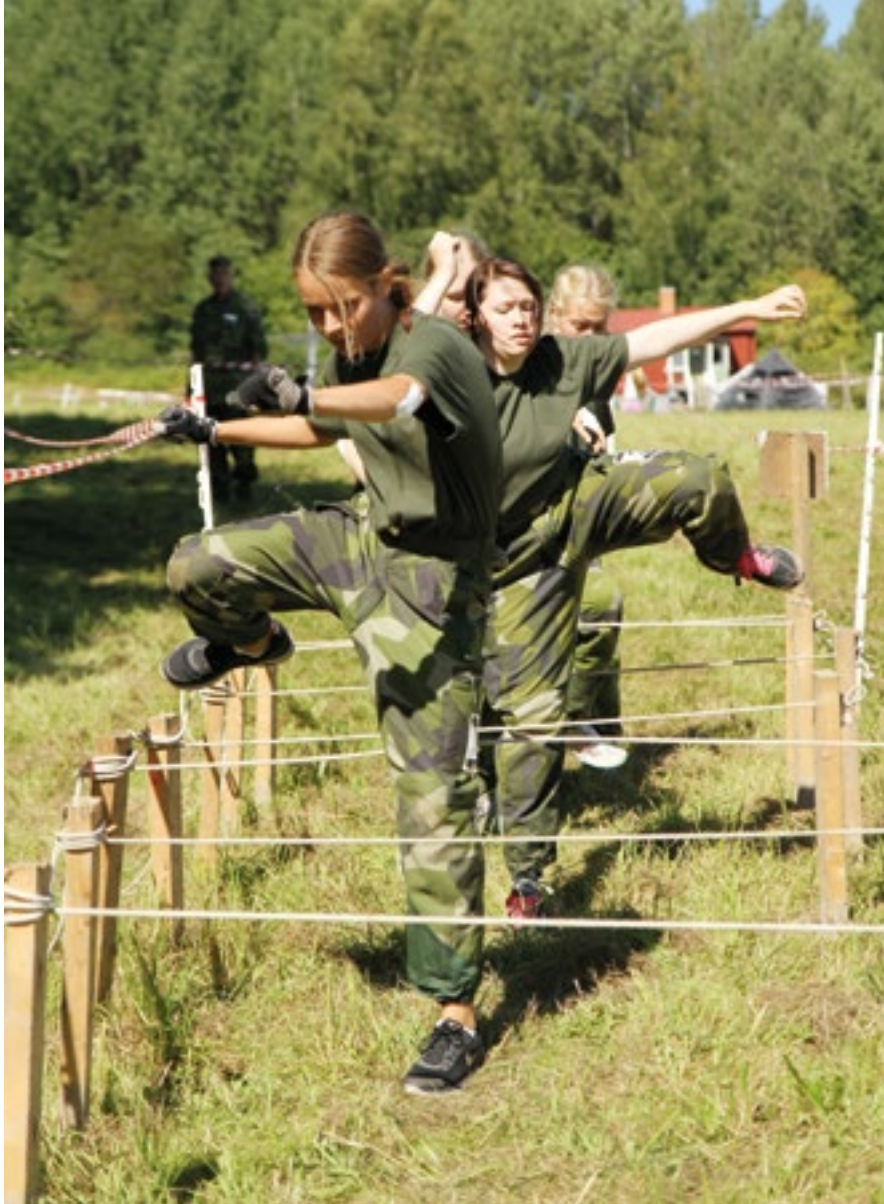
Ofta är det lagets prestationer som räknas.

orientering i ett fjäll- och vinterlandskap. Vi fick också teoretisk utbildning som var inriktad på hur vinterförhållandena påverkade kroppen, psyket och även vardagliga saker som matlagning och förläggning vintertid. Några veckor senare genomfördes Vintertjänst fördjupning , där vi fick utveckla våra kunskaper och samla nya erfarenheter. På kursgården, också denna gång i Ånn, bodde vi i logement med bra standard och bjöds på god mat i matsalen.