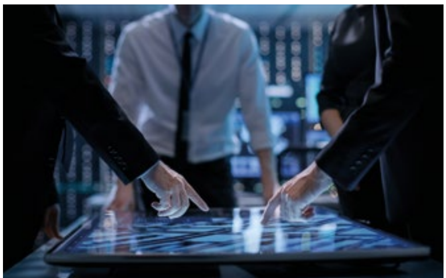
Påverkansoperationer mot vårt land pågår hela tiden.

Lars Holmqvist är egen företagare och reservofficer.